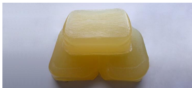
Everad® HAP 3385 ist in Packfree Blöcken erhältlich und kann für diverse Schmelztank-Tvoen verwendet werden