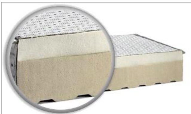
Der Schmelzklebstoff Everad® HAP 3385 eignet sich für die Verklebung von verschiedenen Schaumstoffen, Latex und Vlies.