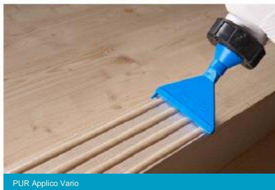
PUR Applico Vario