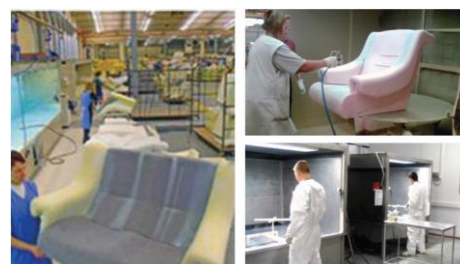
Anwendungsbeispiele wässrige Everad® TAC 2K Kontaktklebstoffe