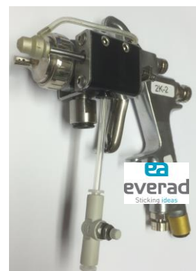
Co-Sprühverfahren für Everad® TAC 2014 A + TAC 2013 B