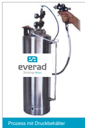
Prozess mit Druckbehälter