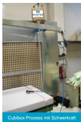
Cubibox Prozess mit Schwerkraft