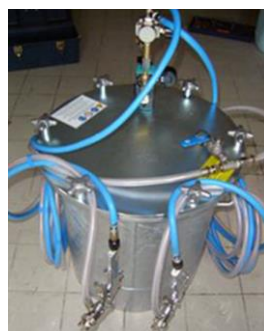
Unité de pulvérisation Everad® TAC Easy MDG-70 avec 2 pistolets de pulvérisation