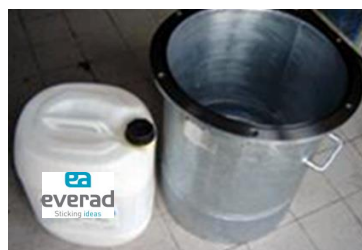
Jerrycan Everad® TAC 1K placé directement dans la cuve sous pression