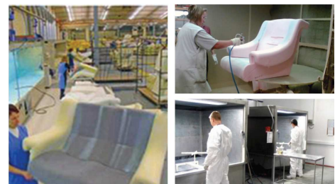
Anwendungsbeispiele wässrige Everad® TAC 2K Kontaktklebstoffe