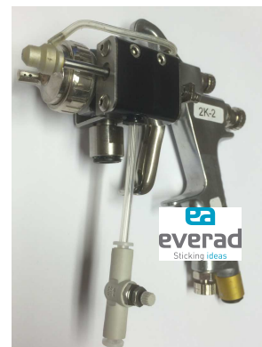
Co-Sprühverfahren für Everad® TAC 2020 A + TAC 2013 B