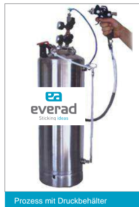
Prozess mit Druckbehälter