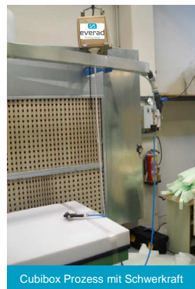
Cubibox Prozess mit Schwerkraft