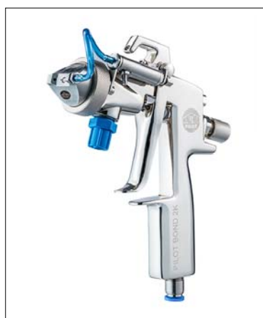
Co-Sprühverfahren für Everad® TAC 2031 A + TAC 2013 B