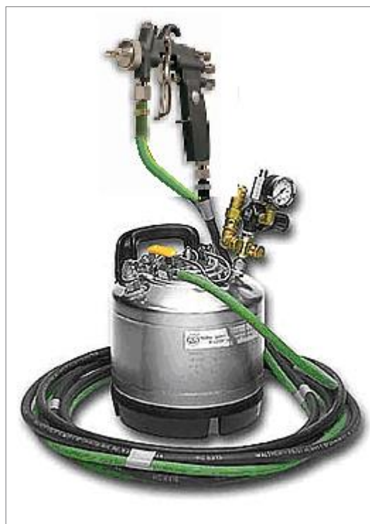
Unité Everad® TAC Easy MDG 5