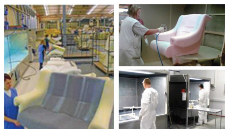
Exemple d'application de colles aqueuses bi-composantes