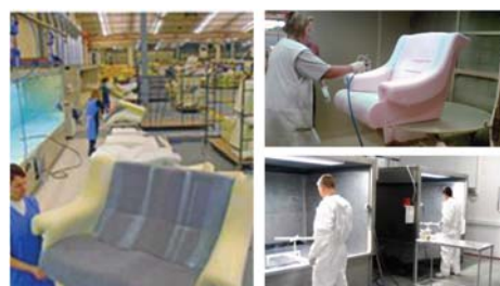
Exemple d'application de colles aqueuses bi-composantes