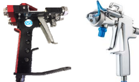
Concept de co-pulvérisation des deux composants Everad® avec pistolets Everad TAC 2K Noverspray ou Everad TAC 2K-3