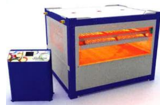
Sécheur infrarouge Sahara® de Quarrata Forniture