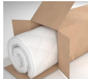
Livrez votre matelas quelques heures après sa commande !

Un plan de retour sur investissement personnalisé peut vous être établi sur demande à : contact@everad-adhesives.com .