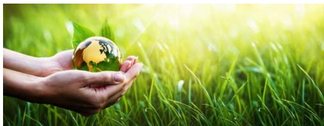
Everad® TAC 6005.0 : la colle pour participer à la protection de l'environnement