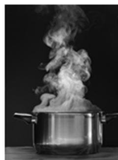
Everad® TAC 6005.0 : des performances exceptionnelles