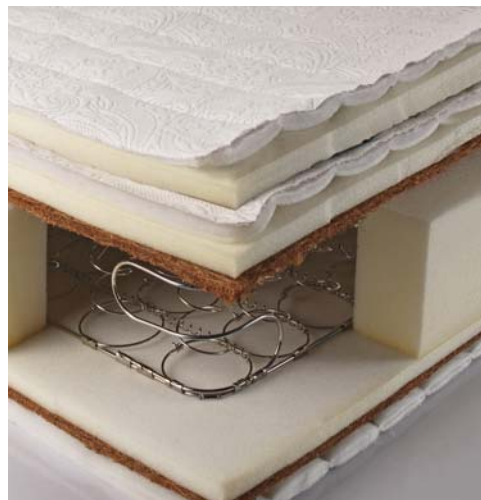
Everad® HAP 3497 Premium est adaptée pour tous les collages dans la fabrication des matelas ressorts et mousses