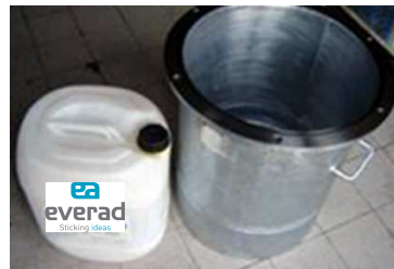
Jerrycan Everad® TAC 1K placé directement dans la cuve sous pression