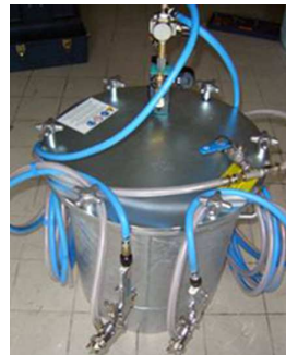
Unité de pulvérisation Everad® TAC Easy MDG-70 avec 2 pistolets de pulvérisation